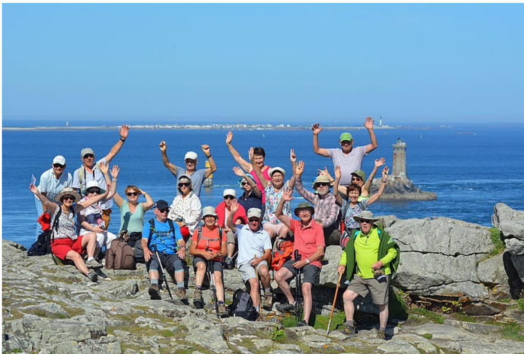
2/2 Randonnée de l'an passé autour de la Pointe du Raz

Le Groupe Randonnée-Nature de Treillières organise un week-end découverte de la presqu'île du Cap-Sizun en Finistère, les samedis 18 et dimanche 19 mai prochains. Au programme : le samedi, circuit (11 km) de la Pointe du Van et son patrimoine ; le dimanche, visite guidée de la réserve ornithologique du Cap-Sizun avec l'association Bretagne-Vivante, le matin, et balade le long du sentier des douaniers (GR34) jusqu'à Pors-Théolen, via les pointes de Penharn et de Brézelleg, l'après-midi. L'hébergement du samedi soir est assuré dans le gîte communal de Beuzeg-Cap-Sizun. Le coût du week-end s'élève de 50€ à 55€/personne. Il comprend : le repas du samedi soir, l'hébergement en gîte, le petit-déjeuner, le pique-nique du dimanche midi et la visite guidée de la réserve ornithologique). L'adhésion annuelle à l'association de randonnée étant par ailleurs de 5€ par an et par adulte. Renseignements et réservations dans les meilleurs délais : tél. 02 40 94 50 60 ou 06 60 75 75 33.